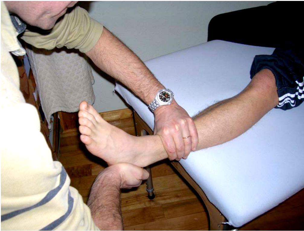
Test de la médio-tarsienne